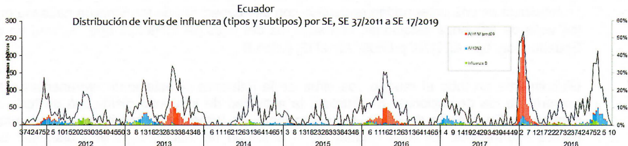
Gráfico 1. Distribución de virus de Influenza (tipo y subtipo) por SE Ecuador 2013–2019*