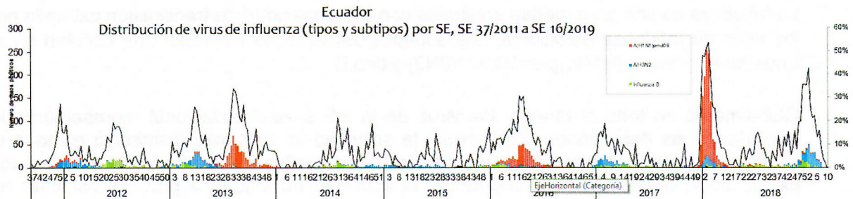
Gráfico 1. Distribución de virus de Influenza (tipo y subtipo) por SE Ecuador 2013–2019*