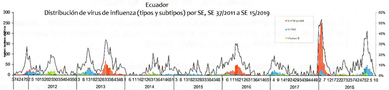
Gráfico 1. Distribución de virus de Influenza (tipo y subtipo) por SE Ecuador 2013–2019*