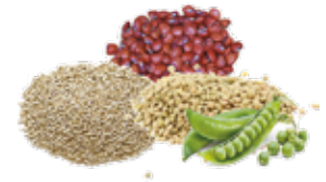
Granos y leguminosas