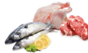
Carnes, pescado y mariscos