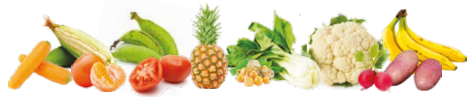
Frutas y vegetales de varios colores tienen fibra, vitaminas y minerales

Añade color y sabor a tus preparaciones con vegetales variados.