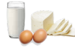
Huevos y lácteos