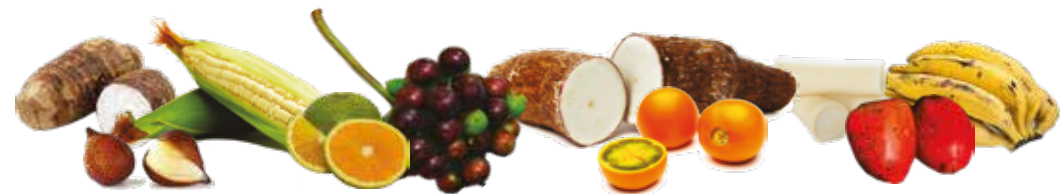
Frutas y vegetales de varios colores tienen fibra, vitaminas y minerales

Añade color y sabor a tus preparaciones con vegetales variados.