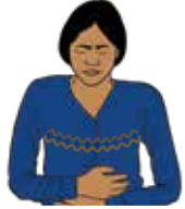
Fuerte dolor de vientre