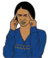
Fuerte dolor de cabeza y visión borrosa