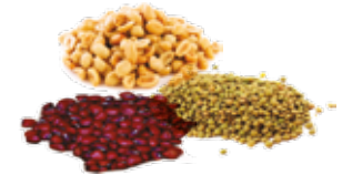
Granos y maní