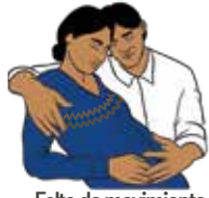
Falta de movimiento de tu hijo o hija

Ante cualquier señal de alarma, acude inmediatamente al establecimiento de salud más cercano o llama al 911