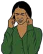
Fuerte dolor de cabeza y visión borrosa