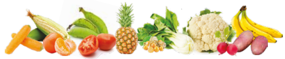
Frutas y vegetales de varios colores tienen fibra, vitaminas y minerales

Añade color y sabor a tus preparaciones con vegetales variados.