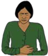
Fuerte dolor de vientre