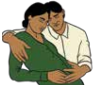
Falta de movimiento de tu hijo o hija

Ante cualquier señal de alarma, acude inmediatamente al establecimiento de salud más cercano