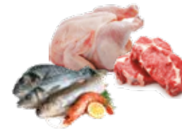
Carnes, pescado y mariscos