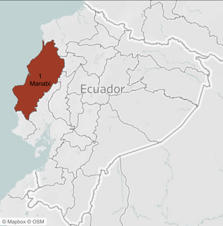
Mapa N° 1 Muertes Maternas por provincia de fallecimiento SE 2

Fuente : SIVE/DNVE corte : 20-1-2026 Fecha de