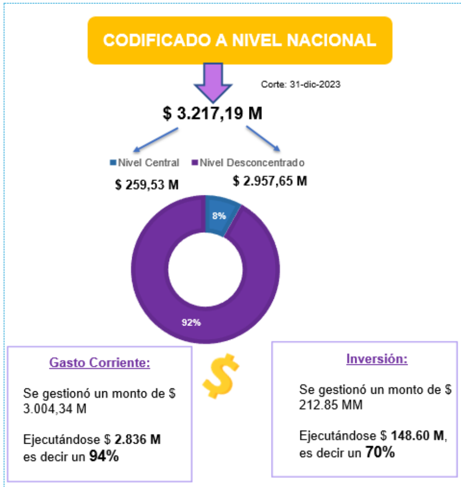
Ilustración 1: Ejecución Presupuestaria a Nivel Nacional