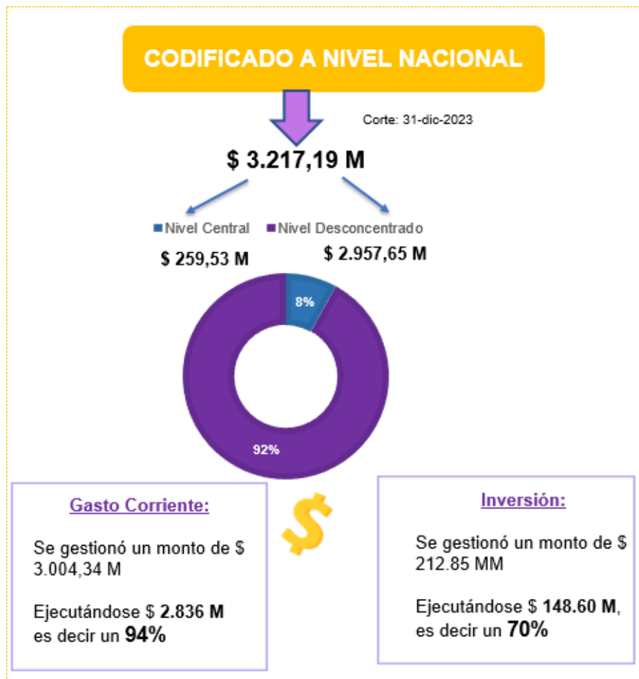
Ilustración 1: Ejecución Presupuestaria a Nivel Nacional