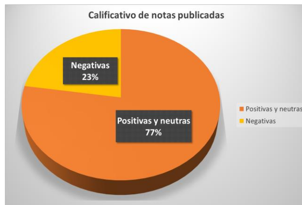
Ilustración 3 Calificativo de notas publicadas

Elaborado por: Coordinación de Prensa y Relaciones Públicas