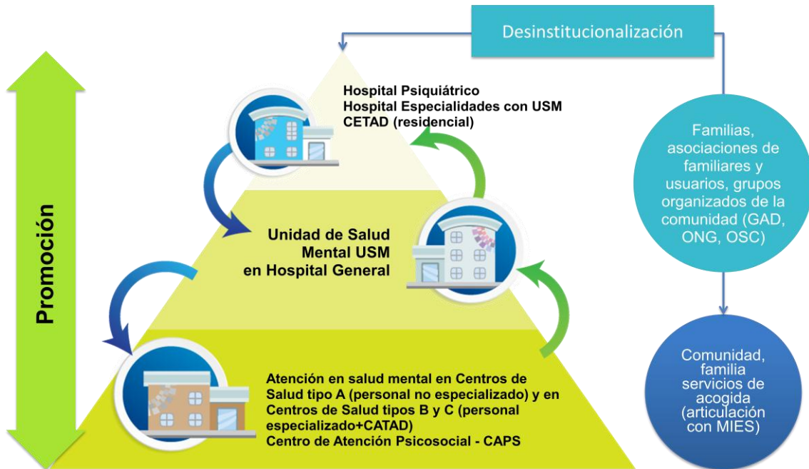
Gráfico 3: Modelo de Atención de Salud Mental

Elaborado por: Equipo técnico de la Comisión de Salud Mental