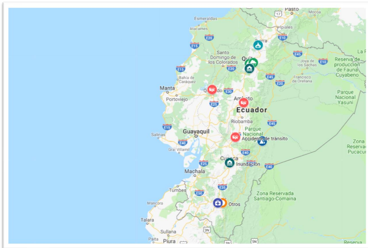
Figura 3. Mapa eventos peligrosos notificados según parámetros de sala situacional-noviembre del 2018.

Elaborado por: Sala de Situación Nacional – DNGR – MSP.