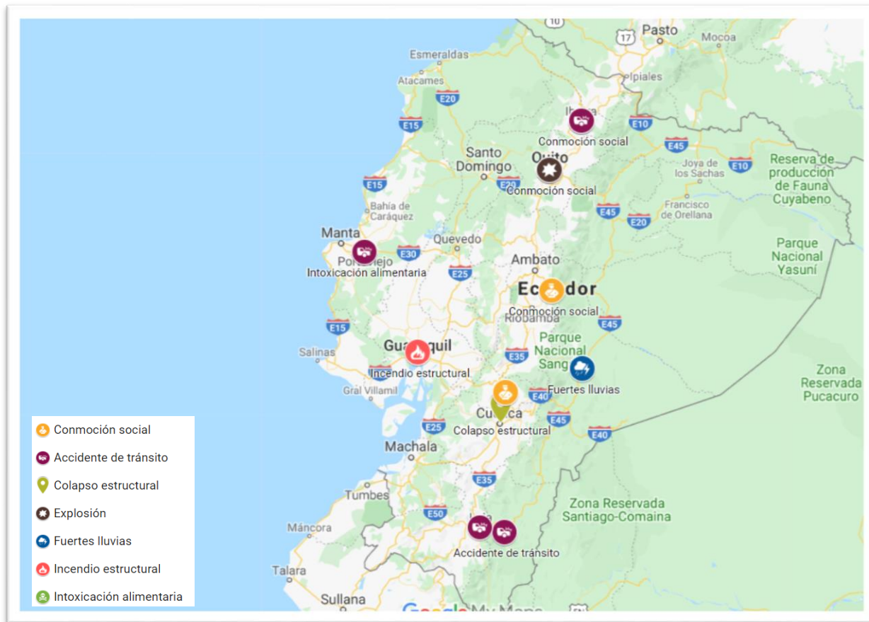
Mapa 1. Mapa eventos peligrosos notificados según parámetros de sala situacional-octubre del 2019.

Elaborado por: Sala de Situación Nacional – DNGR – MSP.