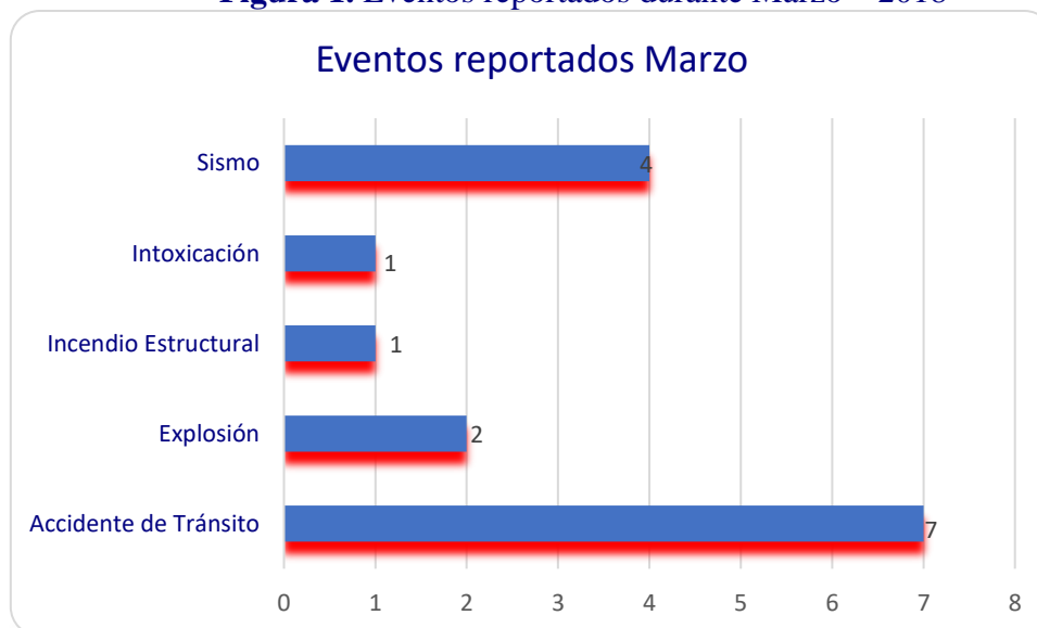
Figura 1. Eventos reportados durante Marzo – 2018

Elaborado: Sala de Situación Nacional – DNGR