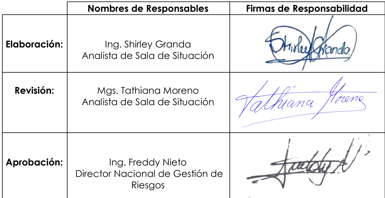
Tabla 5. Firmas de Aprobación del Informe