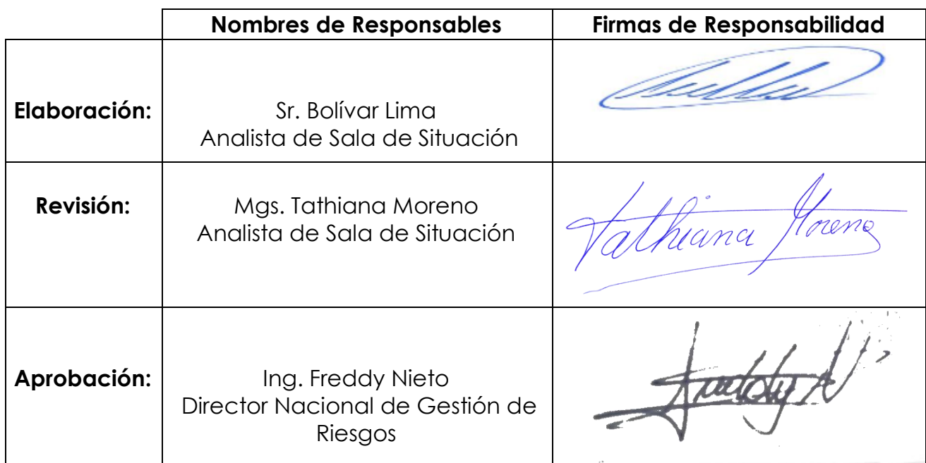
Tabla 5. Firmas de Aprobación del Informe