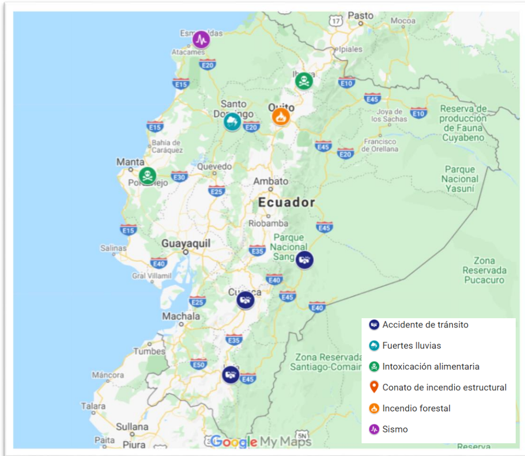
Mapa 1. Mapa eventos peligrosos notificados según parámetros de sala situacional - enero del 2020.

Elaborado por: Sala de Situación Nacional – DNGR – MSP.