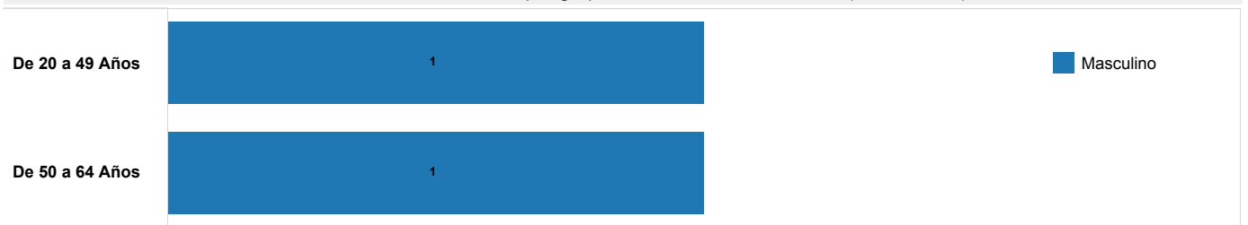
Caso de LEPTOSPIROSIS, por grupos de edad, sexo, año 2020 (hasta SE 02)