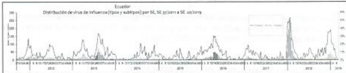
Gráfico 1. Distribución de virus de Influenza (tipo y subtipo) por SE Ecuador 2013–2019*