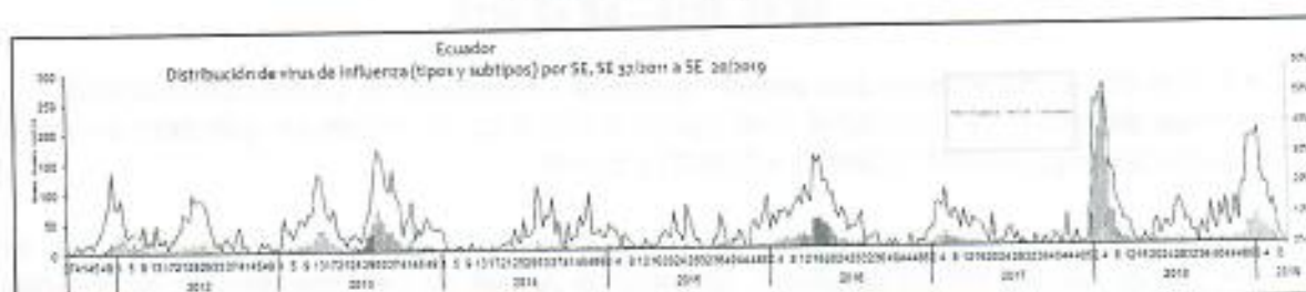
Gráfico 1. Distribución de virus de Influenza (tipo y subtipo) por SE Ecuador 2013–2019*