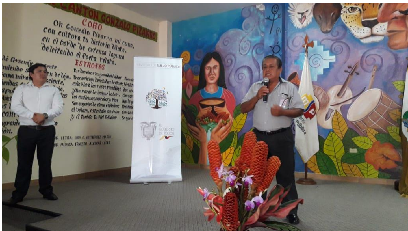
Ilustración 6 INTERVENCIÓN DEL PRESIDENTE DEL COMITE DISTRITAL 21D01 SALUD