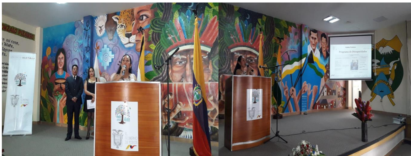
Ilustración 3 SOCIALIZACIÓN GESTIÓN 2018

Parte del ejercicio de la democracia representativa, es informar y explicar a los ciudadanos las acciones realizadas por el gobierno de manera transparente y clara, para dar a conocer su estructura y funcionamiento. Esto permite volver realidad principios democráticos de gobiernos que son controlados por los ciudadanos.