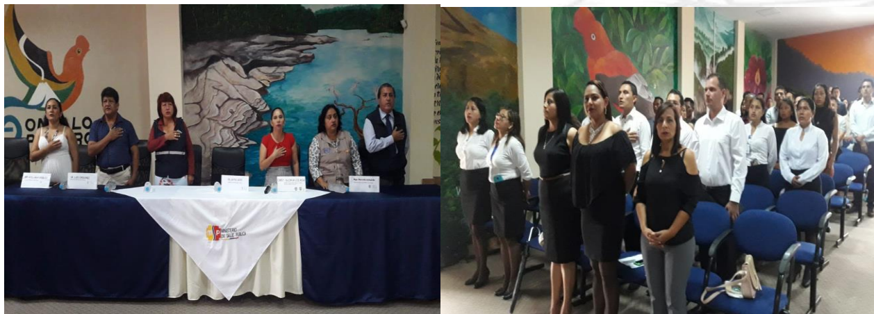
Ilustración 2 ENTONACIÓN DEL HIMNO NACIONAL DEL ECUADOR

Para dar inicio al evento, les invitamos a ponerse de pie para proceder a entonar las sagradas notas del Himno Nacional del Ecuador. (3 min.)