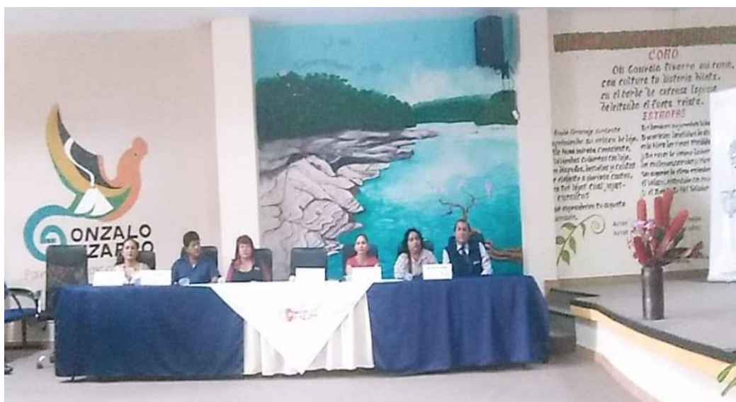
Ilustración 1 AUTORIDADES QUE CONFORMARON LA MESA - 21D01 RC 2018