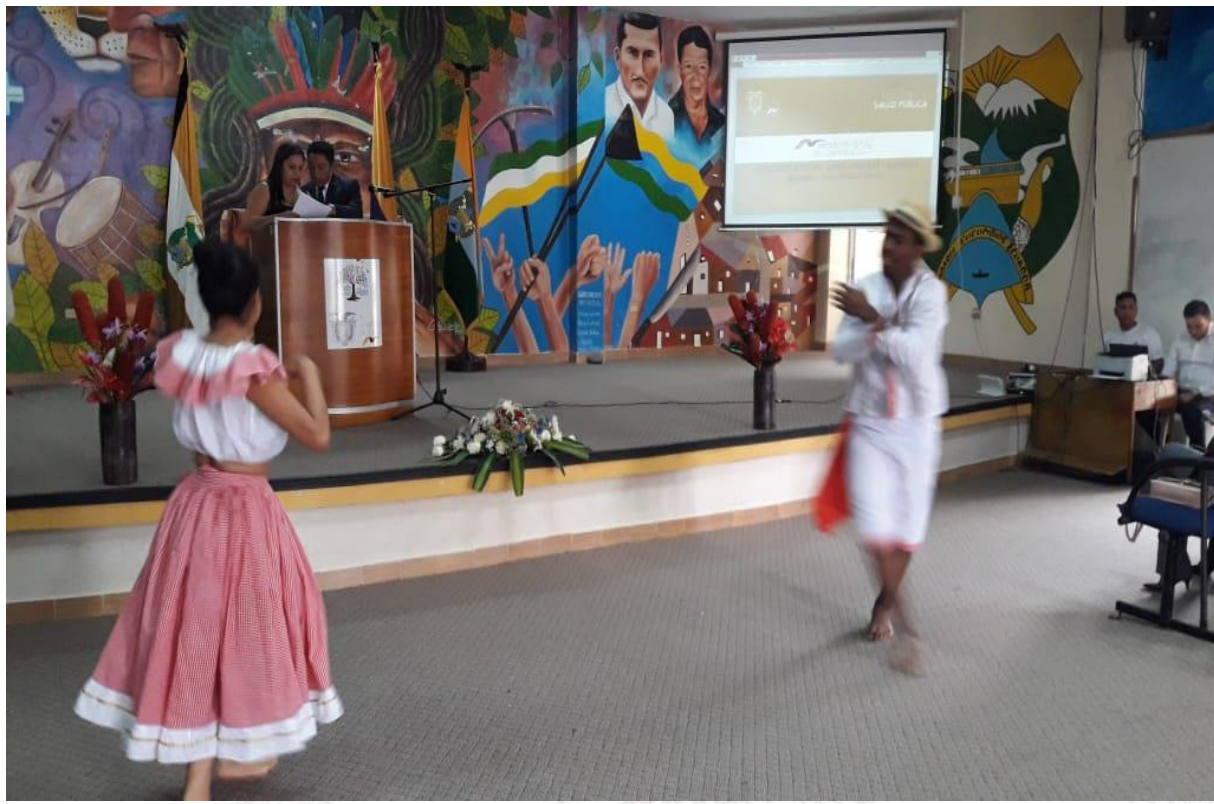
Ilustración 4 INTERVENCIÓN ARTÍSTICA- DANZA CULTURAL

6. Entrega de Certificados a los Promotores de Salud y Parteras.- La dirección Distrital 21D01 Cáscales – Gonzalo Pizarro – Sucumbíos – Salud en convenio con el GAD Municipal del cantón Gonzalo Pizarro emprendió curso de capacitaciones referente a Promotores de Salud y Parteras, el mismo que se lo hizo con la finalidad de incentivar y promover este trabajo a beneficio de la comunidad.