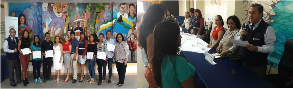
Ilustración 5 ENTREGA DE CERTIFICADO A PROMOTORES DE SALUD Y PARTERAS