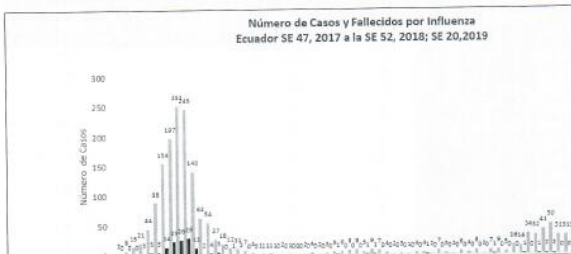
Gráfico 2. Número de Casos y Fallecidos por Influenza por Semana Epidemiológica Ecuador SE 47 (19 de noviembre, 2017) a la SE 20 (18 de mayo, 2019)