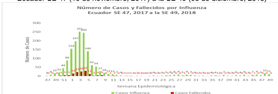
Gráfico 2. Número de Casos y Fallecidos por Influenza por Semana Epidemiológica Ecuador SE 47 (19 de noviembre, 2017) a la SE 49 (08 de diciembre, 2018)