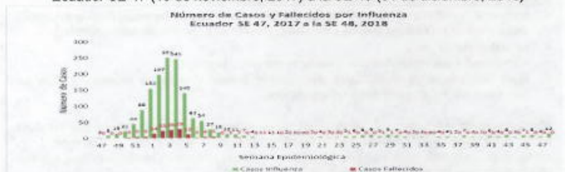
Gráfico 2. Número de Casos y Fallecidos por Influenza por Semana Epidemiológica Ecuador SE 47 (19 de noviembre, 2017) a la SE 48 (01 de diciembre, 2018)