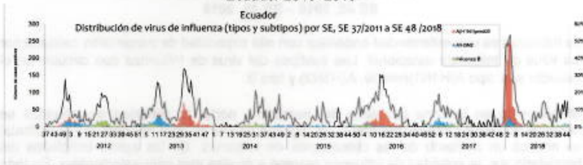
Gráfico 1. Distribución de virus de Influenza (tipo y subtipo) por SE Ecuador 2013–2018*