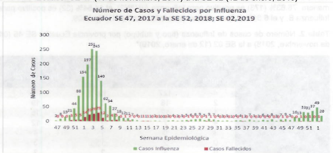
Gráfico 2. Número de Casos y Fallecidos por Influenza por Semana Epidemiológica Ecuador SE 47 (19 de noviembre, 2017) a la SE 02 (12 de enero, 2019)

Fuente: Sistema de Vigilancia Centinela de IRAG/SIVE Alerta- Corte 19 de enero 2019; 24:00 Elaboración: Dirección Nacional de Vigilancia Epidemiológica *Nota: El reporte de casos de Influenza y de fallecidos se realiza en la SE en la que iniciaron los síntomas, por lo que todos los casos y defunciones están sujetos a actualización según confirmación por laboratorio.