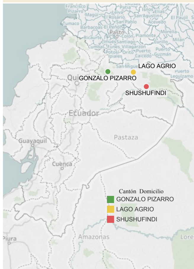
Casos de Fiebre Amarilla por Cantón en Ecuador hasta SE 01-27/2017