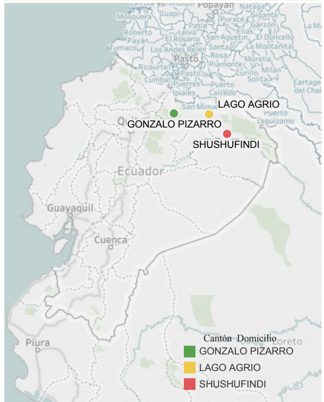
Casos de Fiebre Amarilla por Cantón en Ecuador hasta SE 01-28/2017